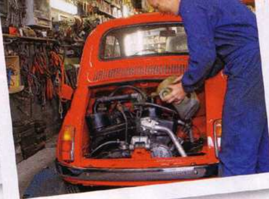
Motoröl auffüllen VOR DER ERSTEN AUSFAHRT MUSS ERST MAL DER ÖLSTAND GEPRÜFT WERDEN