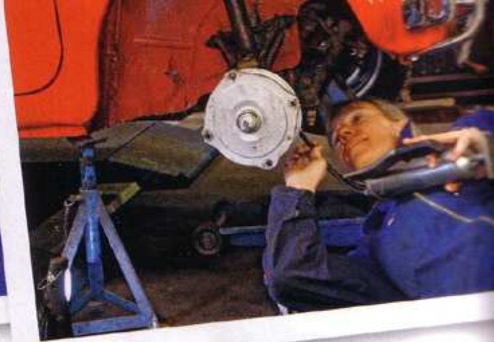
Achse abschmieren DIE NEUEN ACHSSCHENKEL MÜSSEN NATÜRLICH REGELMÄSSIG GESCHMIERT WERDEN

Tochter energisch zur Sache und fegte dabei alle bremsenden Argumente ihres skeptischen Gatten vom Tisch.